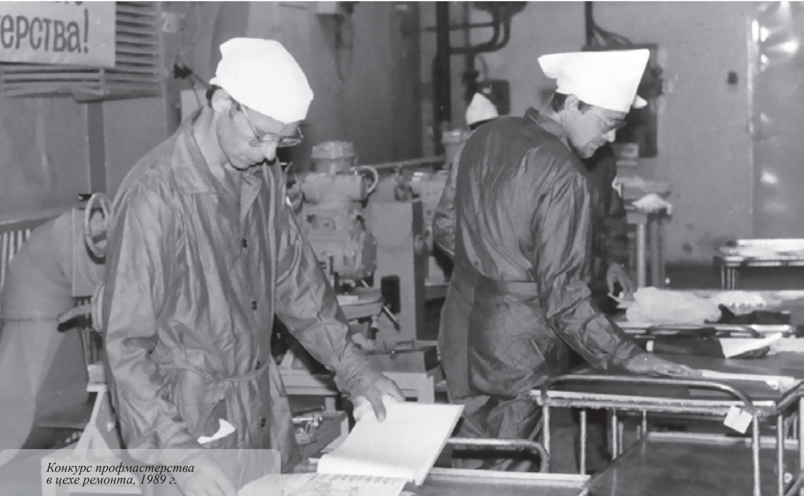
Конкурс профмастерства в цехе ремонта, 1989 г.