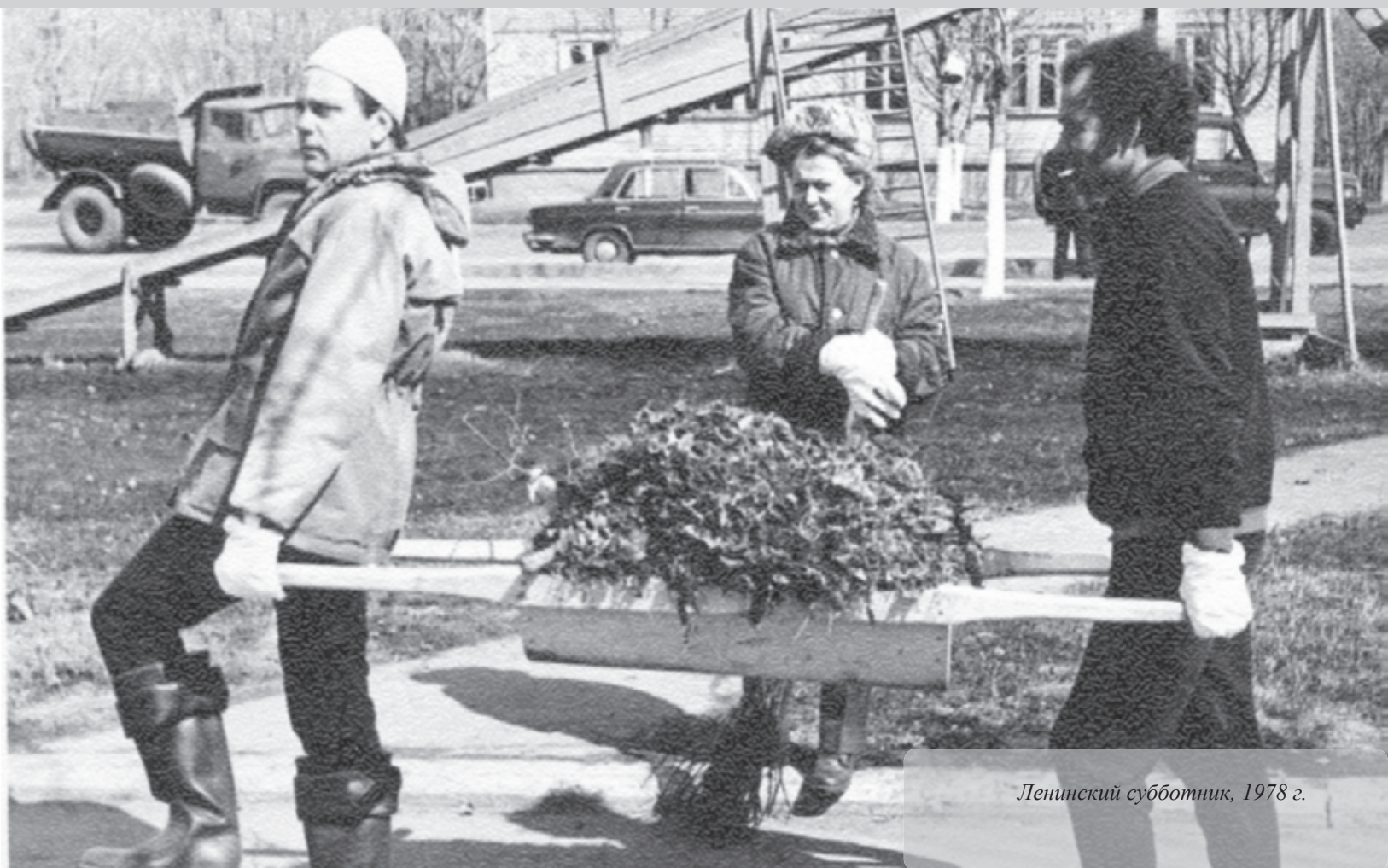
Ленинский субботник, 1978 г.