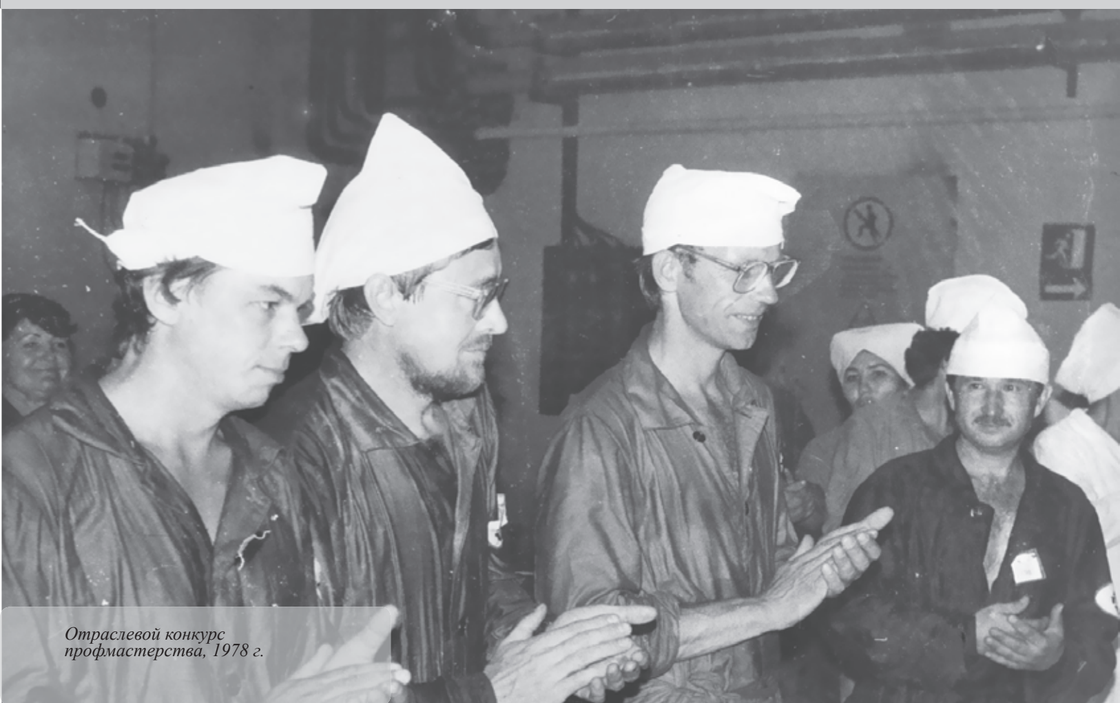
Отраслевой конкурс профмастерства, 1978 г.