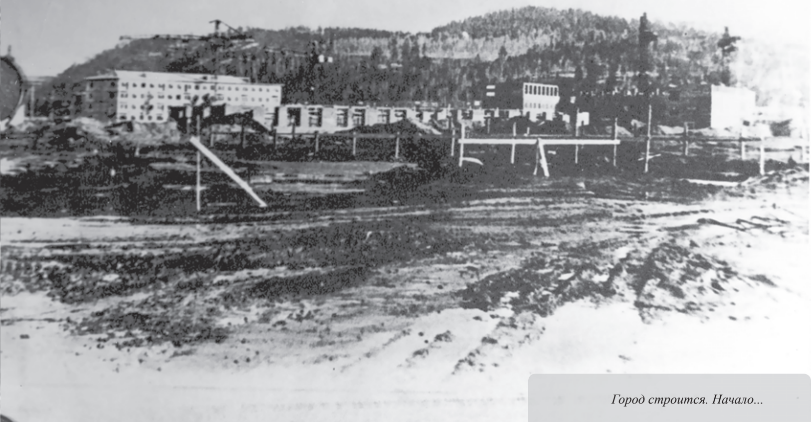
Город строится. Начало...