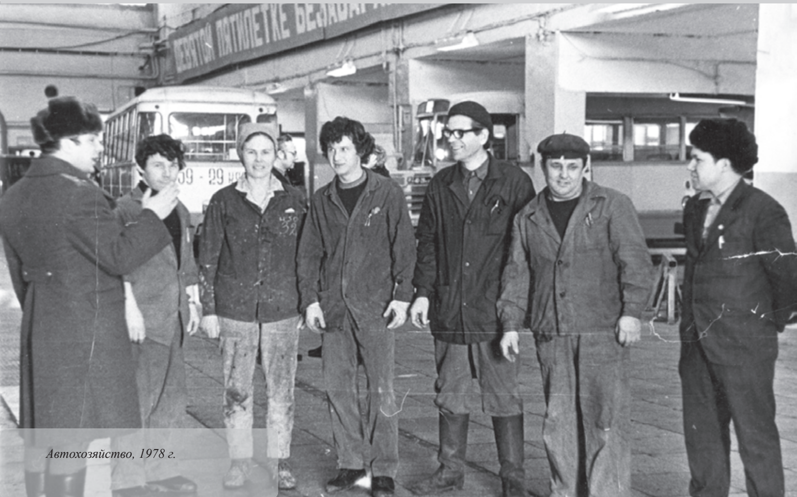
Автохозяйство, 1978 г.