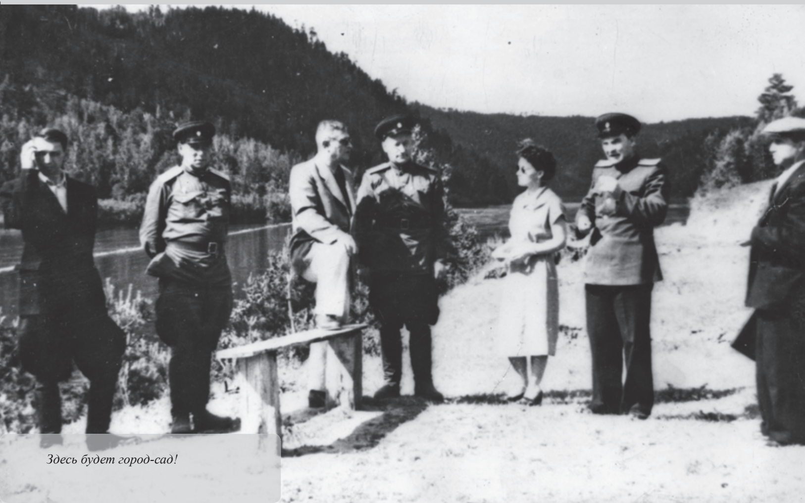
Здесь будет город-сад!