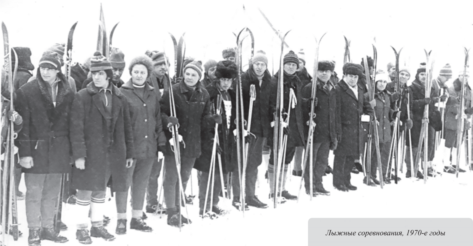
Лыжные соревнования, 1970-е годы