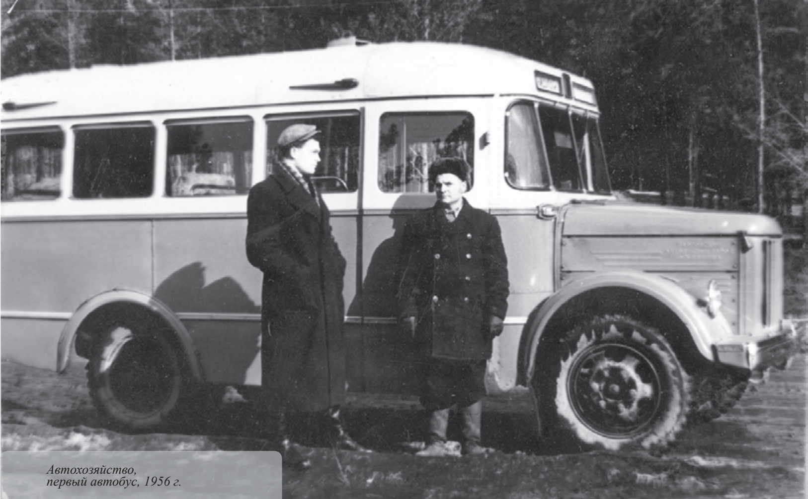
Автохозяйство, первый автобус, 1956 г.