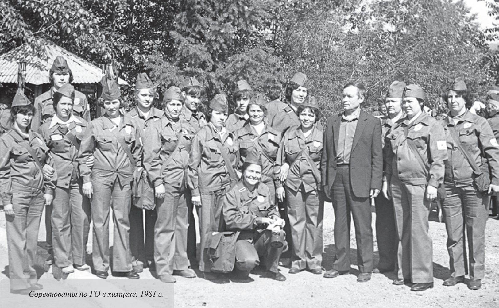
Соревнования по ГО в химцехе. 1981 г.