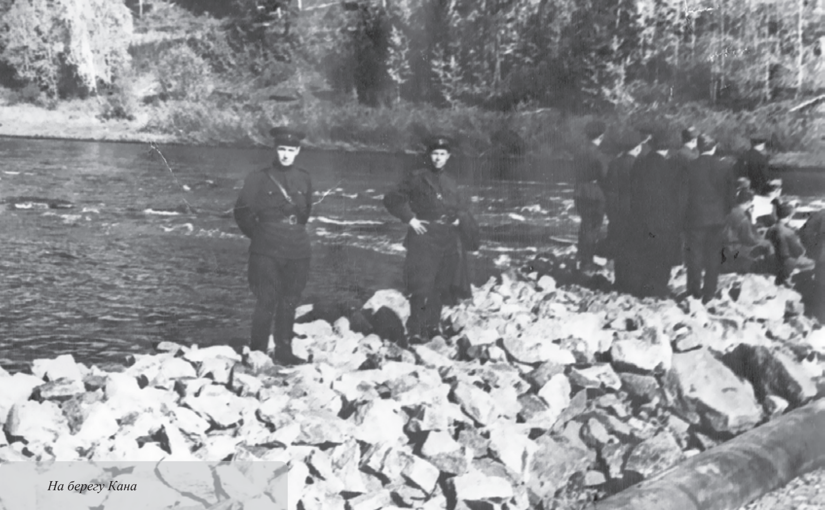
На берегу Кана