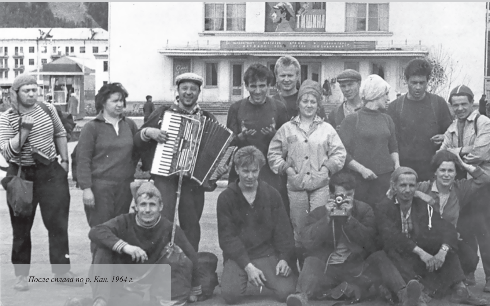
После сплава по р. Кан. 1964 г.