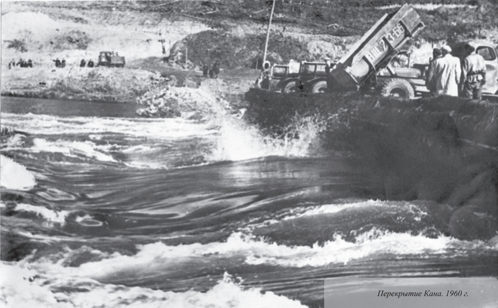
Перекрытие Кана. 1960 г.