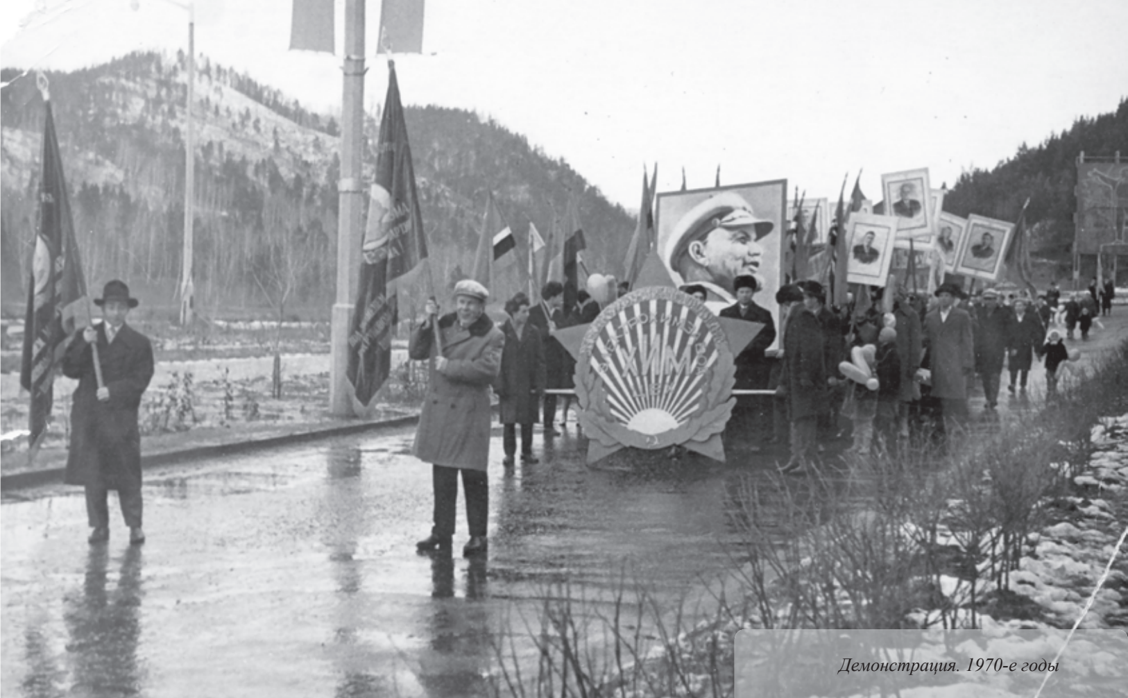
Демонстрация. 1970-е годы