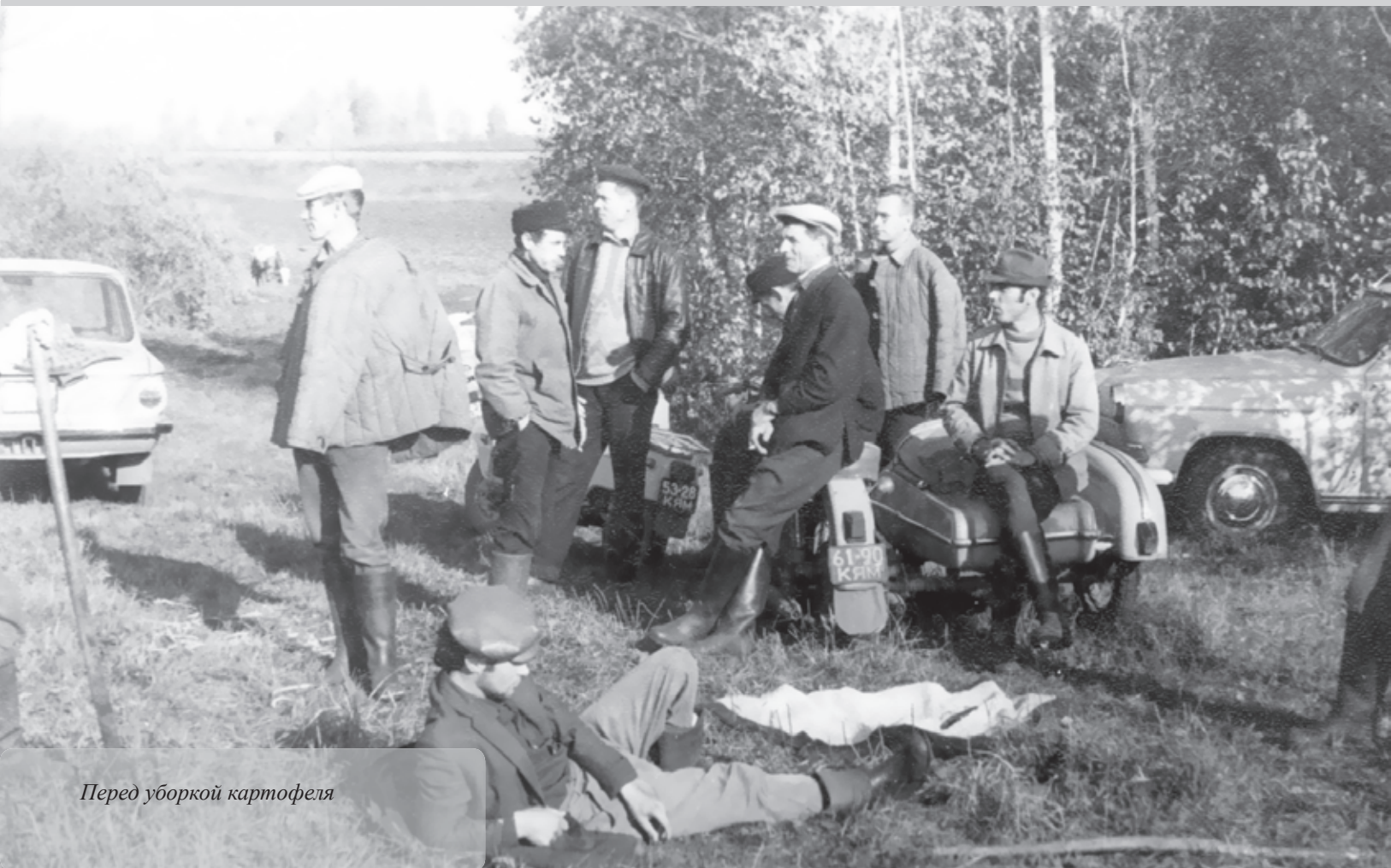
Перед уборкой картофеля