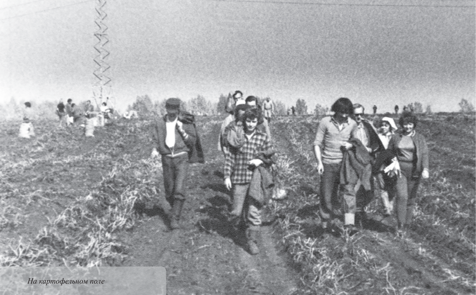
На картофельном поле