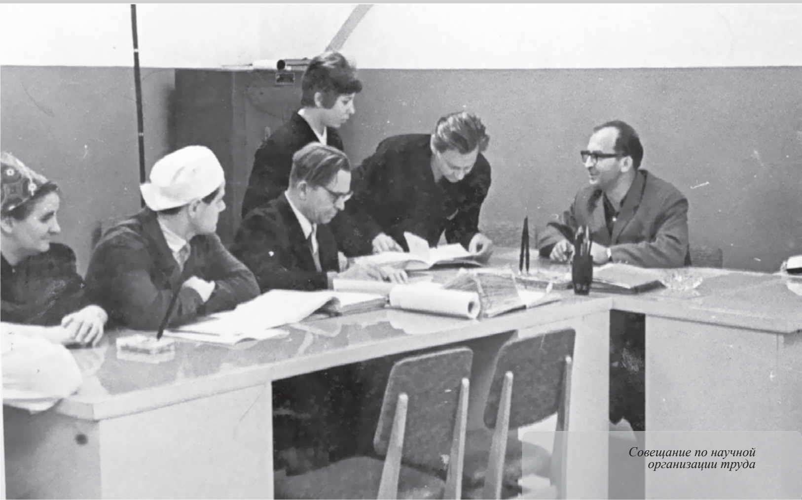
Совещание по научной организации труда